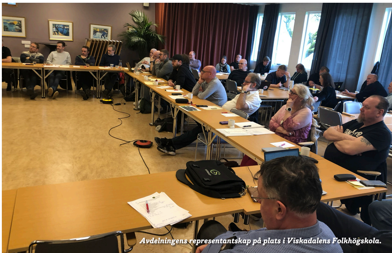
Avdelningens representantskap på plats i Viskadalens Folkhögskola.