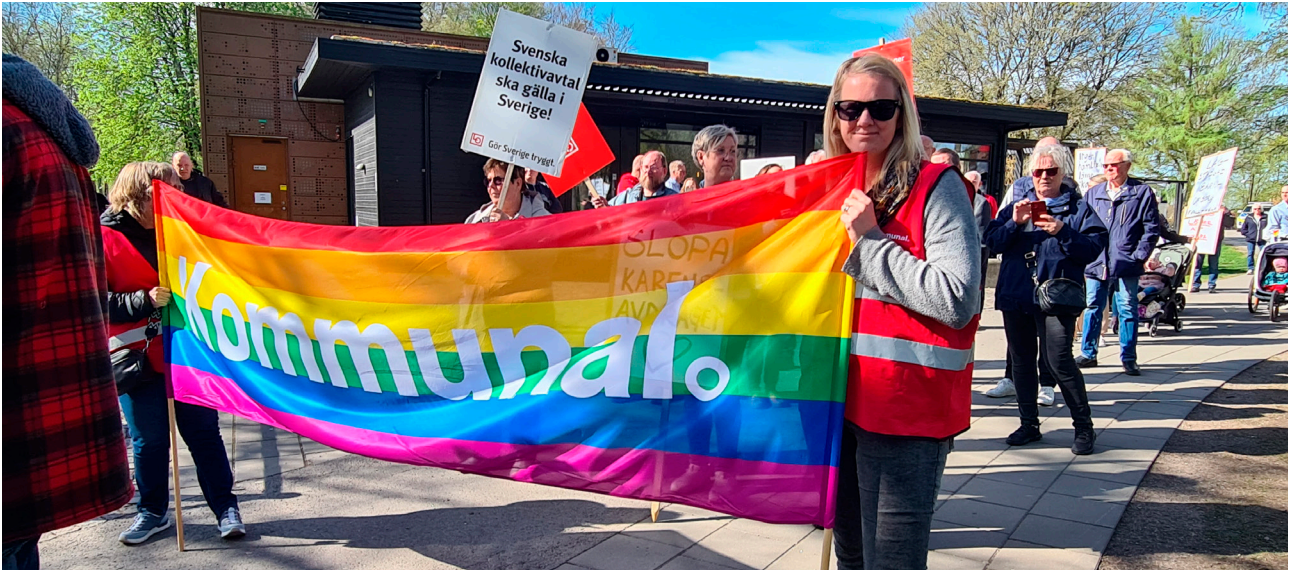
Många LO förbund på plats i Falköping.