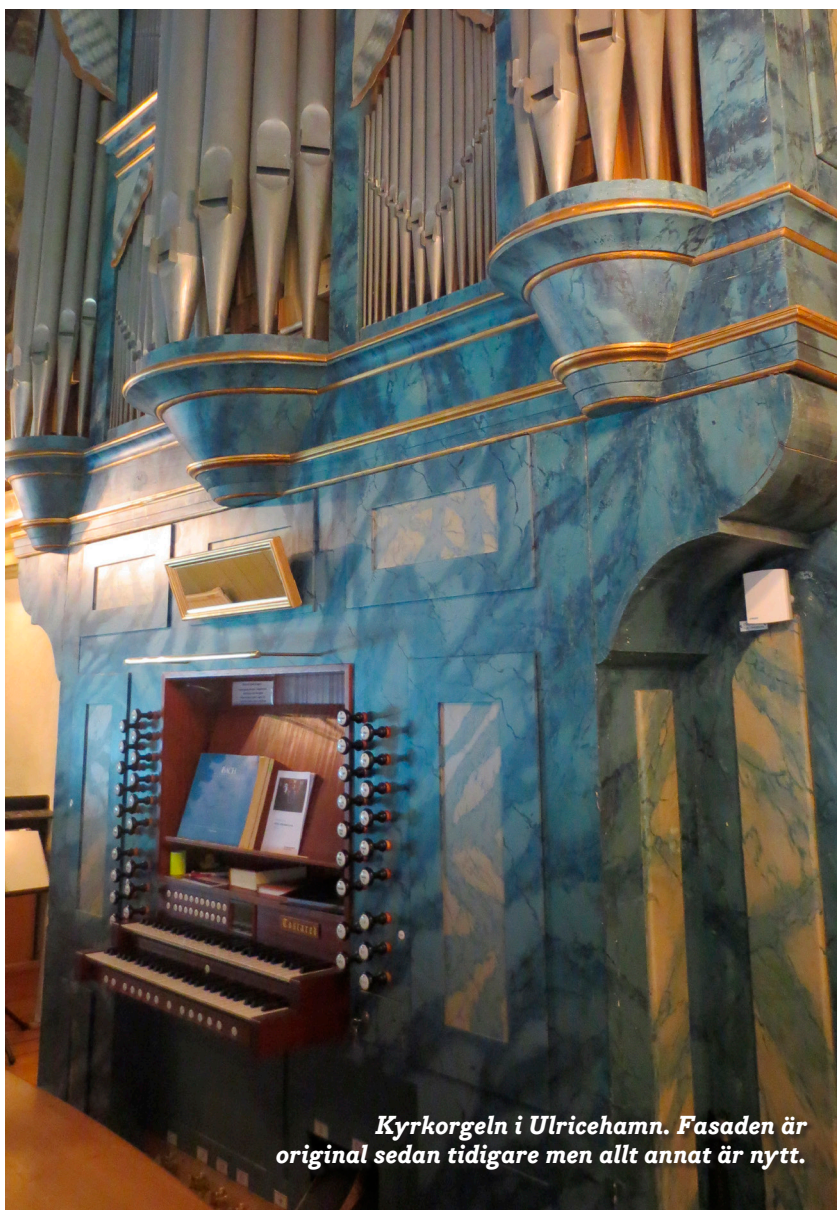
Kyrkorgeln i Ulricehamn. Fasaden är original sedan tidigare men allt annat är nytt.