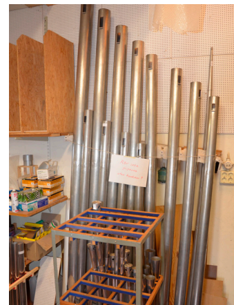
Fabriken har en egen piptillverkning, vilket man är ensamma om i Sverige.