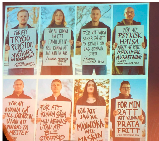
Gripande inspel från Tesla anställda.