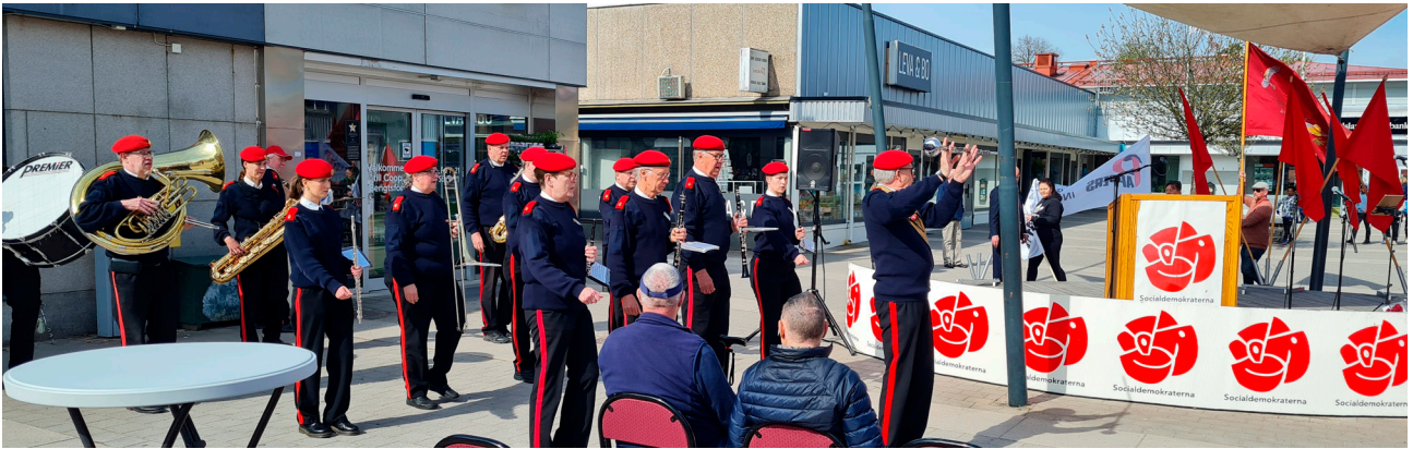
Blåsorkester i Bengtsfors.