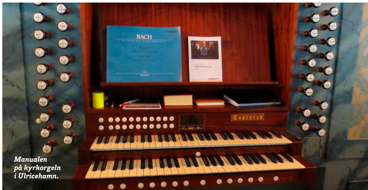
Manualen på kyrkorgeln i Ulricehamn.

Att som förtroendevald få besöka arbetsplatser är verkligen en ynnest! Att få träffa medlemmar och arbetsgivare i deras rätta element, i deras vardag. Man upphör aldrig förvånas över hur olika det kan se ut. Ett besök i Tostareds orgelfabrik är något man inte glömmer i första taget.