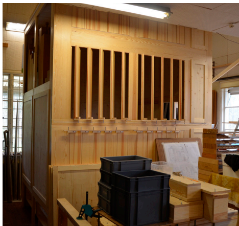
Ny orgel på gång som ska till Norrköping.

Av de 2000 kyrkor som finns i Sverige har Tore arbetat i drygt 600. Vid vårt besök byggdes en orgel som ska pryda en kyrka i Norrköping. Kostnaden landar på ungefär 6,5 miljoner kronor och tar ett år att bygga. 70 procent av arbetet görs i fabriken och 30 procent i kyrkan beroende på orgelns storlek och utformning. Ingen av de nya orglarna är alltså spelbara på plats i fabriken. Den största orgel man har byggt var otroliga 12 meter hög! Det kan ta upp till tre månader att bygga upp orgeln i kyrkan och få till ljudet på plats så att allt klingar