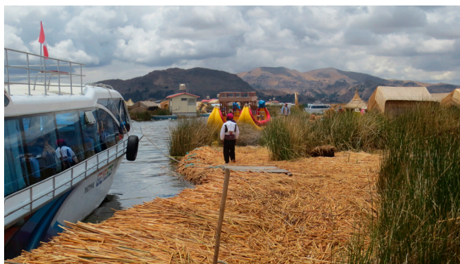
De flytande öarna av vass på Titicaca sjön bor det ungefär 2000 personer.

Efter en lång bussresa från Titicacasjön och staden Puno (tio timmar) kom vi till Cusco, InkaIndianernas huvudstad som finns med på Unescos världsarvslista. Staden var mycket