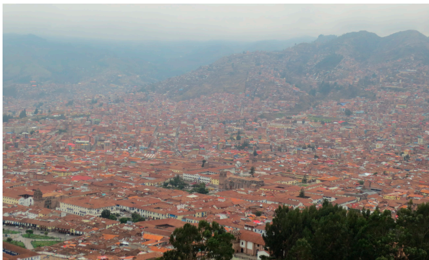
Cusco, Perus tredje stan, tillika inkahuvudstad. Flygplats mitt i stan!

Den sista riktigt stora begivenheten på resan var Rainbow Mountain. Dagen startade med en hissnande bussfärd på slingriga serpentinvägar som var i mycket dåligt skick, rullgrus och sten och utan ett enda räcke! När bussen äntligen stannade befann vi oss på 4350 meter över havet. Här började vandringen som skulle ta oss upp till över 5000 meter. Nu hade vi vant oss. Vandringen var krävande, men alla vi som var med kom upp till toppen. Berget skiftar i regnbågens färger, från grönt till rött, från vitt till svart. Det är sediment från metaller, koppar, järn, zink och tenn. Innan 2005 var detta ingen sevärdhet alls, då täckte snön dessa bergstoppar. Men klimatförändringarna har ändrat på det, ett tråkigt konstaterande, men det hindrade inte upplevelsen trots allt. Även här hade vi tur med vädret, vi såg ytterligare en topp där