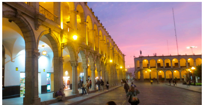
Torget i Perus näst största stad, Arequipa. Stan kallas för ”Den vita staden” på grund av en bergart som är vit och som många byggnader i Arequipa är byggda i.