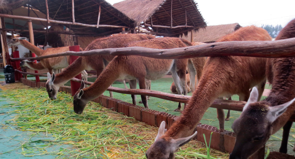
Alpackor och Lamadjur finns över stora delar av Peru. Deras ull är fantastisk och svindyr.

var oerhört långt hemifrån. Staden ligger nästan 2400 meter över havet och är omgiven av tre vulkaner. När vi åkte ut från Arequipa passerade vi de fattiga kvarteren som uppfördes så sent som på åttiotalet. Herregud vilka ruckel till bostäder, det var helt förfärligt att se.