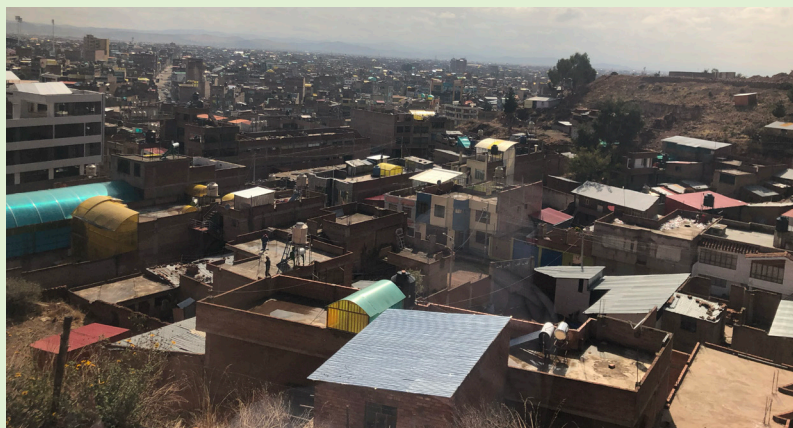
Julicaca, finansiellt centrum i Peru.

”Ingen i denna region betalar någon skatt”