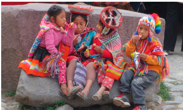
Ung som gammal, alltid färgglada kläder.

dades 1520 och kallas för ”Den vita staden”, detta på grund av den vita vulkaniska sten som flertalet byggnader i staden var uppförda med. De centrala delarna var oerhört vackra med fasader som påminde oss att vi