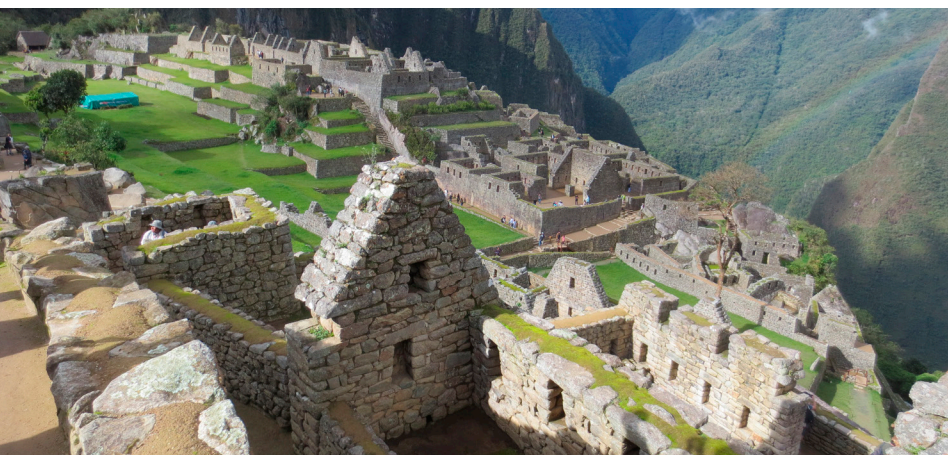
Machu Picchu upptäcktes 1911. En fascinerande vandring genom Inkastaden som innehöll, bostäder, terrassodlingar, soltempel och mycket annat, ett väl utvecklat samhälle.

Det är inte helt okomplicerat att ta sig till Machu Picchu. Bussen från Cusco släppte av oss i den underbart pittoreska staden Ollantaytambo. Därifrån åker man tåg genom Urubambadal, inkafolkets heliga dal som är början av Amazonfloden. Vill man inte vandra hela vägen till Machu Picchu stad är tåget enda alternativet. Hit går inga vägar. Väl framme i staden som var en riktig turistfälla åkte man buss upp till själ-