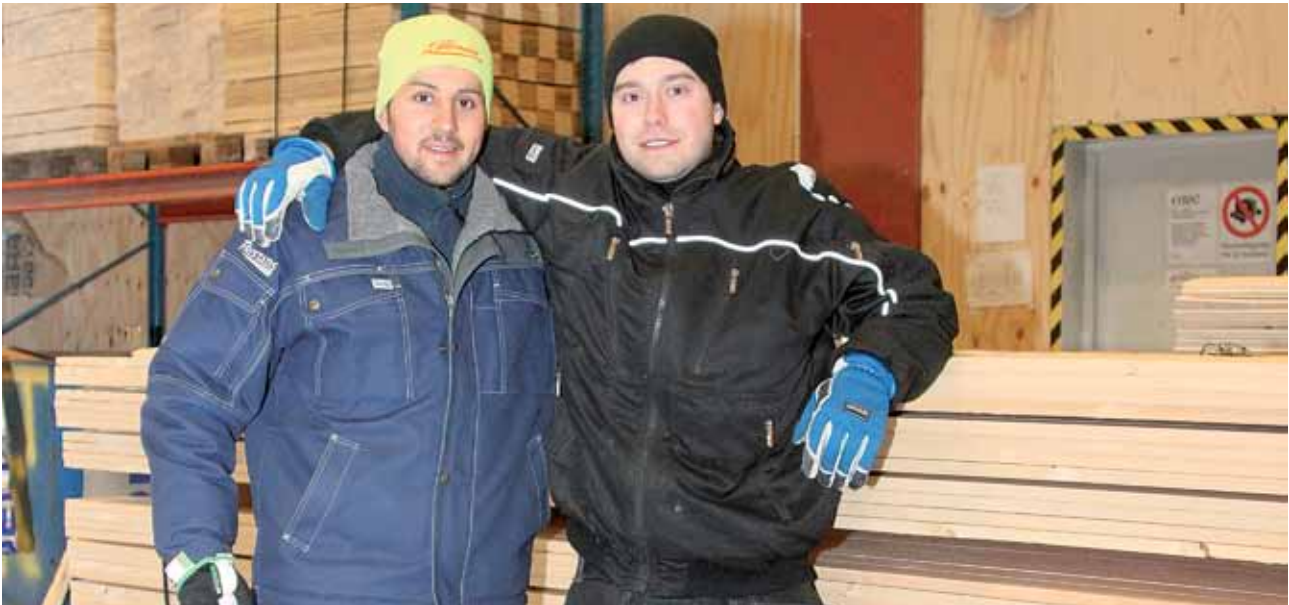
Medlemmar på Fredells.