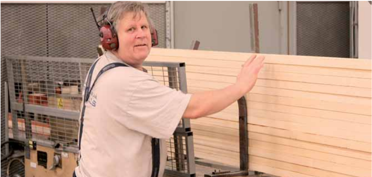
Medlem på Fredells.