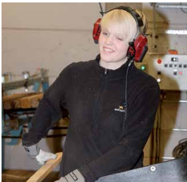
Medlem på Heby Sågverk.

Arbetstagare i lönegrupperna 2 och 3 med två års anställning vid företaget skall ha en lön som över- stiger lägsta timlön med minst 230 öre/tim. samt vid fyra års anställning med minst 460 öre/tim.