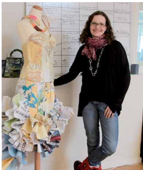
Medlem på Intellecta.