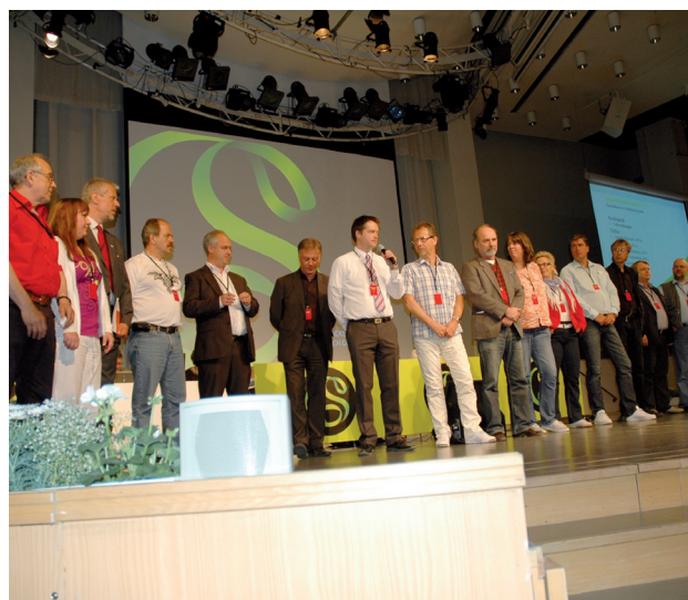
Den nya förbundsstyrelsen. Kongressen i maj 2009.