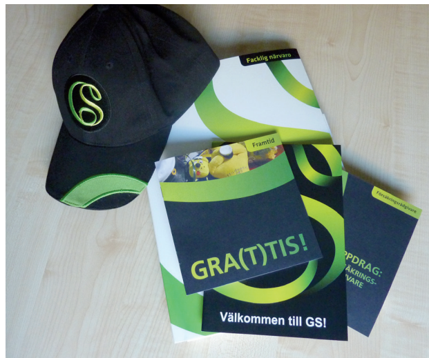
Blandat profil- och informationsmaterial 2009.