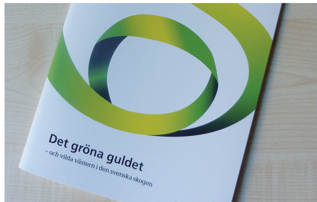
Rapporten "Det gröna guldets".