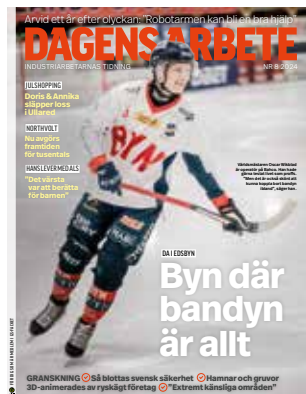
2024 års omslag från Dagens Arbete.