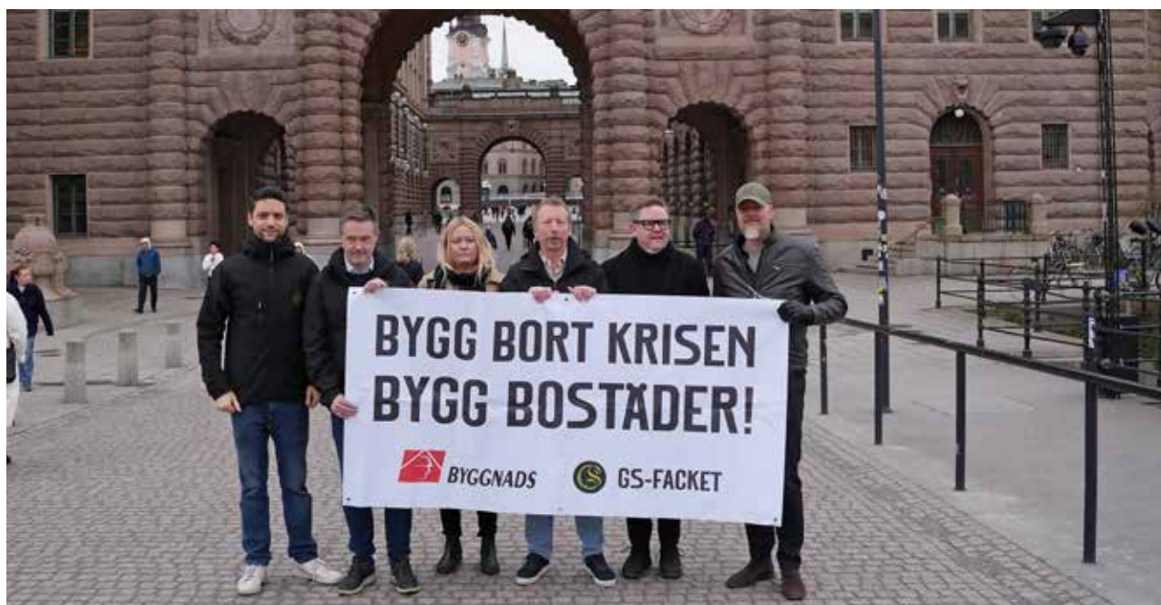
GS-facket demonstrerar utanför riksdagen i samband med vårändringsbudgeten presenteras.