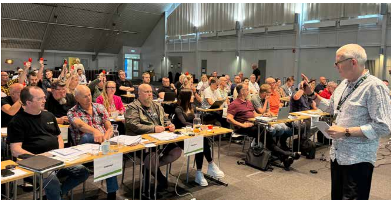
Förbundsmöte 18-19 juni, 2024.