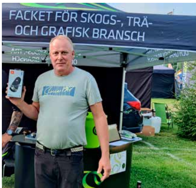
Vinnare dag 1