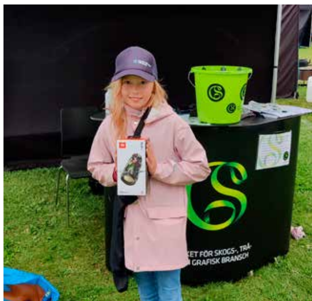
Vinnare dag 2