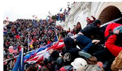
Det som kallats för demokratins högborg, Capitolium i USA, stormas av en mobb med högerextrema antidemokratiska åsikter.