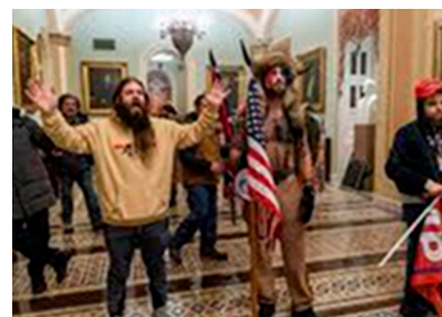
Mobben inne i Capitolium, Washington USA.