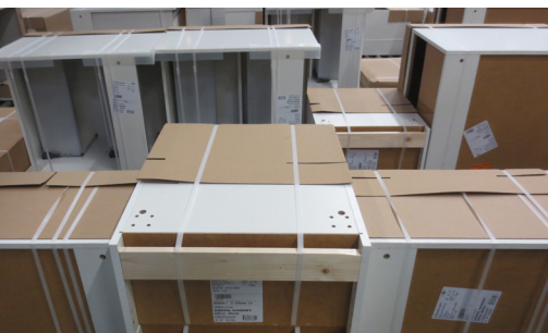
Skåpstommar i väntan på leverans.