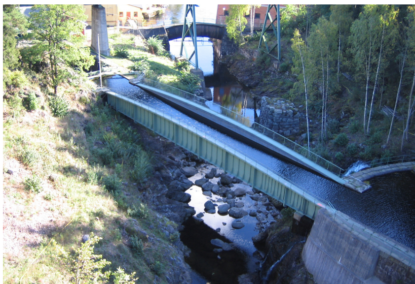
Nils Ericsons sinnrika akvedukt som leder Dalslands kanal förbi forsarna i Häverud, en av Sveriges största sevärdheter med en halv miljon besökare varje år.