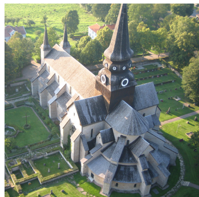
Varnhems klosterkyrka med Kata gård. En riktig turistmagnet i Skaraborg som lockar mängder av besökare.

Tidningen som du nu tittar i heter alltså Spånat & Tryckt och har funnits som medlemstidning i gamla avdelning 7 Skaraborg sedan 2008 när GS bildades. I och med den nya organisationen så kommer du nu få denna tidning också om du tidigare tillhörde avdelning 6 Väst, samt i Dalsland som förut ingick i avdelning 11 Värmland. Gamla och nya läsare hälsas varmt välkomna! Vår ambition med detta blad är att ge medlemmarna information om GS i vårt närområde. Arbetsplatsreportage har alltid varit en viktig del av tidningen, tyvärr är det svårt just i detta nu med pågående pandemi, men den kommer att ta slut och då kommer vi att återuppta våra besök ute i avdelningen. Vi uppmärksammar ibland om medlemmar i avdelningen har lite udda fritidssysselsättningar värt att berätta om. Ibland tycker vi till i politiska frågor, både här hemma och i vår omvärld. Har du tips eller om det är något du undrar över beträffande tidningen kan du höra av dig till någon i info/kommunikationsgruppen. Du hittar våra kontaktuppgifter på hemsidan samt i redaktionsrutan på sida 2.