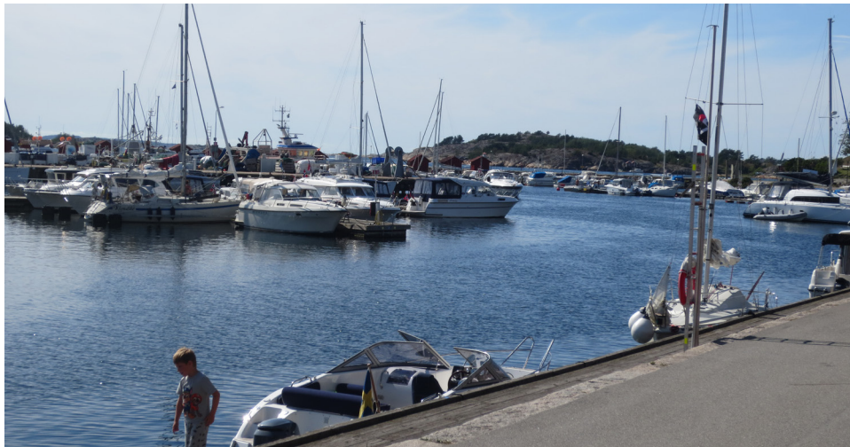
Strömstad, ett av alla örhängen på bäst, förlåt Väst - kusten!

Derome har flera anläggningar i avdelningen med verksamheter som sågverk, husproduktion, brädgårdar. (träindustri samt sågverksavtal) Båttillverkning samt underhåll finns det några stycken, Hallberg-Rassy varv, Orust yachtsservice, Sailyard är några av de större. Flera fönsterfabriker finns i området, Nordan AB, Westcoast Windows, H-fönster är några av de större och är utspridda från Tanum till Göteborg. Många grafiska företag håller till i området Borås-Göteborg men finns i hela området. De tillverkar etiketter-klädtryck-tidningar/reklam-skyltar-bil-dekorosv. Acg-accent, V-tab, Lexit lable, Stema, Elanders, listan kan göras lång. Det finns företag som tillver-