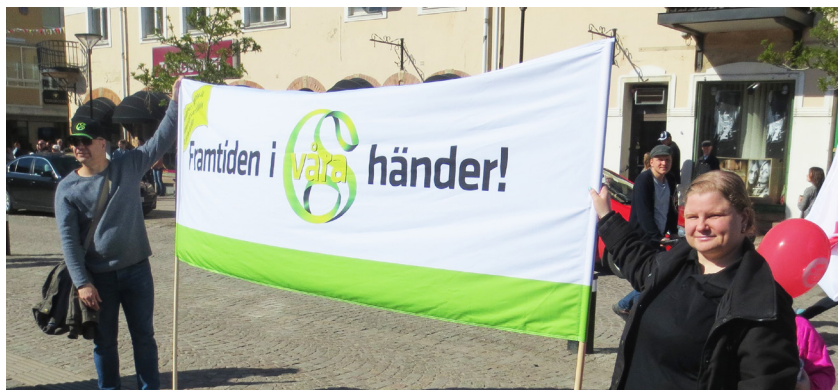
GS medlemmar deltar med glatt humör i demonstrationerna den 1:a maj. Kommer vi få göra det även i framtiden?

här hemma i Sverige. Han har fel. Jag är nämligen helt övertygad om att samma sak kan hända i vårt land. Händelserna i Washington kommer inspirera antidemokratiska missnöjda personer i hela världen, även här i Sverige. Så vad vi nu har att fråga oss är: Hur kommer händelserna i USA bli beskrivna i historieböckerna? Var det den dagen vår demokrati såg början till slutet? Eller var det den dagen då människor och organisationer äntligen vaknade och insåg att vi måste stå upp för våra demokratiska ideal? Det är lätt att vara pessimistisk. Det finns många som nöjer sig med att ägna sig åt dataspel, äta chips och hata på sociala medier. Högerextrema partier blir allt starkare i allt fler länder. Det finns många mörka krafter i samhället och därför måste vi vara uppmärksamma och försvara demokratin.