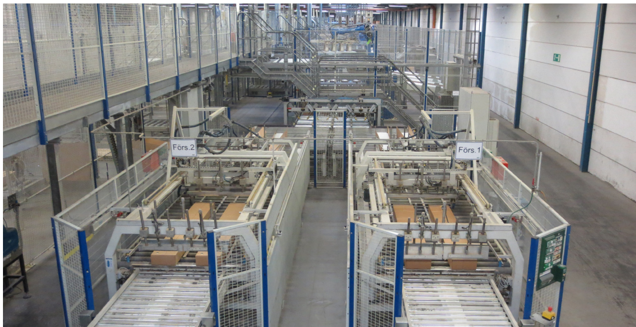
Emballeringsbana 7, den största! Den packar i första hand Billy 80 hög.

Gamla läsare av denna tidning vet att vi i de flesta nummer besöker en eller två arbetsplatser där vi försöker visa vilka olika typer av miljöer våra medlemmar arbetar på. Detta har dock varit svårt under coronapandemin, men nu gör vi en omstart! I detta nummer tänkte vi visa hur det ser ut hos möbeltillverkaren Gyllensvaans Möbler i Kättilstorp, ett företag i Falköpings kommun.