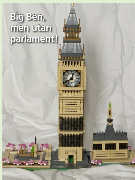
Big Ben, men utan parlament!