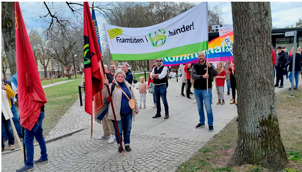
GS i demonstrationståget, med banderoll och allt.

Äntligen traditionellt första majfirande igen! Efter två år av Corona var det äntligen dags att åter fira arbetarnas högtidsdag "på riktigt". I GS sektion Falköping inleddes firandet som sig bör med ett medlemsmöte.