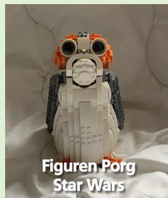
Figuren Porg Star Wars