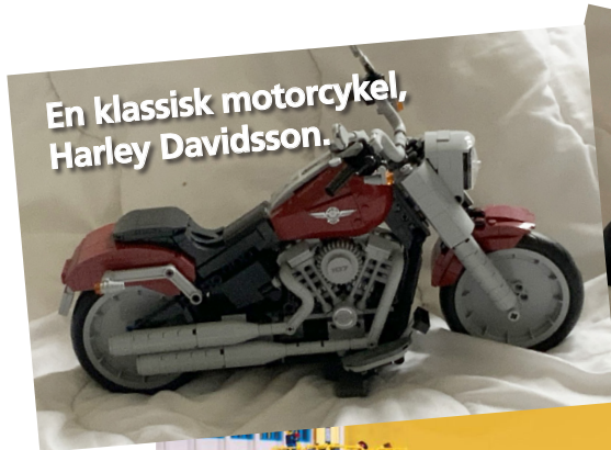
En klassisk motorcykel, Harley Davidsson.