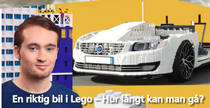
En riktig bil i Lego – Hur långt kan man gå?