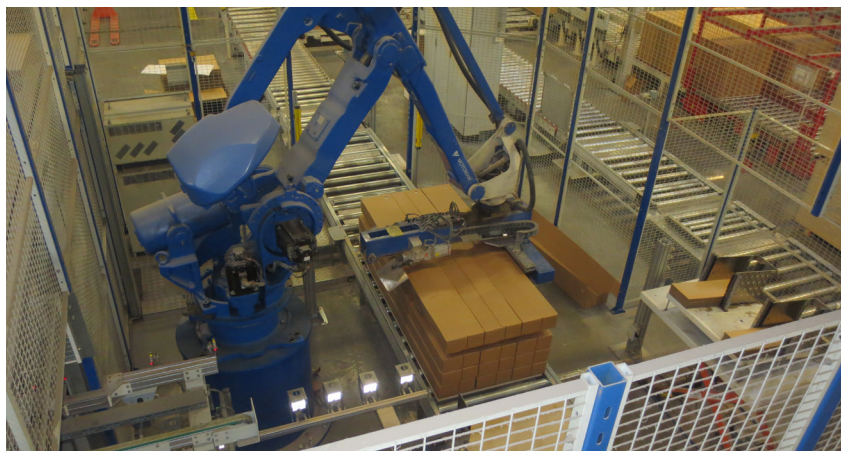
Den sista roboten på bana lägger de färdiga paketen på plats på pallen.