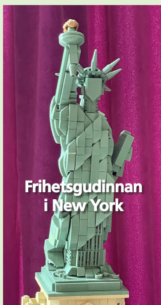
Frihetsgudinnan i New York