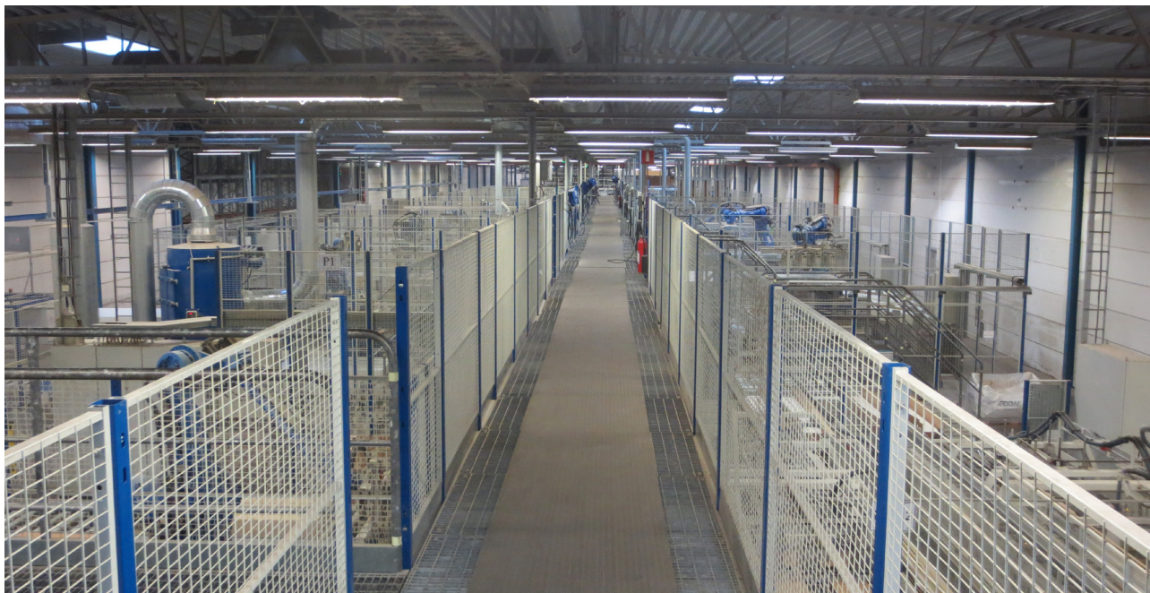
En gång som möjliggör effektiv övervakning över samtliga robotar och banor.