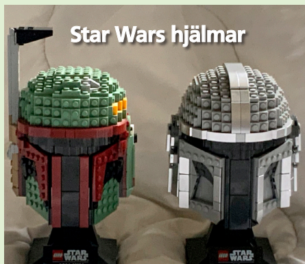
Star Wars hjälmar