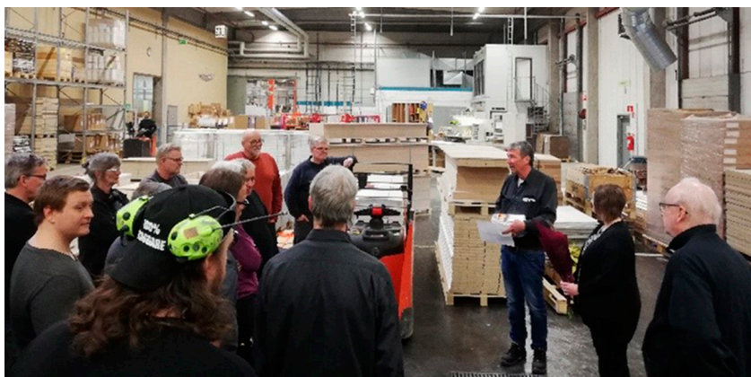
... som av företag.