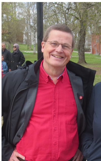
Huvudtalare i Falköping, Patrik Björck, riksdagsledamot och GS medlem.

Äntligen traditionellt första majfirande igen! Efter två år av Corona var det äntligen dags att åter fira arbetarnas högtidsdag "på riktigt". I GS sektion Falköping inleddes firandet som sig bör med ett medlemsmöte.