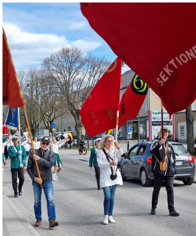
GS med egen fana på manifestationen i Mariestad.

Efter korv och dricka, kaffe och kaka vandrade GS:arna hem igen, nöjda över att verkligheten, åtminstone i vårt land, börjar bli sig likt igen.