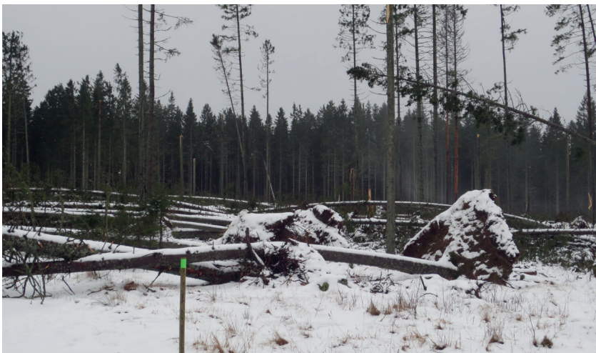
Farlig arbetsmiljö, vad gäller?

Det är sant. Det är ju en av dom mest heta sakerna att diskutera, bland annat när man utbildar nya skyddsombud. Då hör man att "jag kan stoppa arbetet om jag vill". Och ja, det kan ett skyddsombud göra. Ett skyddsombud på en liten arbetsplats kan stoppa arbetet, och ett skyddsombud på en större arbetsplats kan stoppa arbetet på hela arbetsplatsen OM det finns tillräckliga skäl att göra det. En påtaglig risk för någons liv eller hälsa. Då kan skyddsombudet avbryta arbetet direkt på plats. Det kallas för skyddsombudsstopp. Men det ska man endast göra om det finns en direkt risk, inte annars. Mindre saker får man försöka lösa på ett annat sätt.