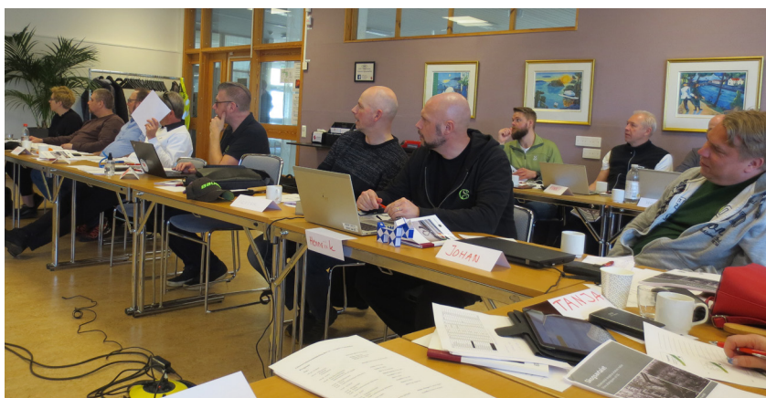
Intresserade åhörare i Viskadalen.