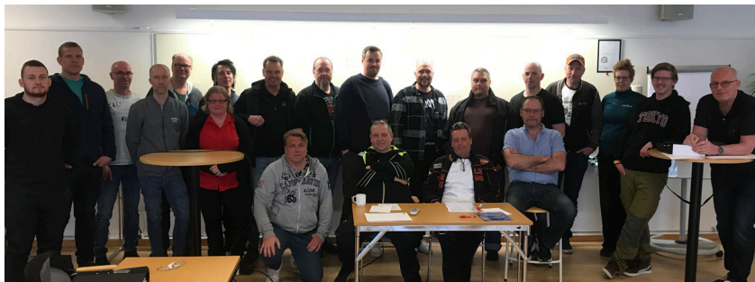
Avdelningens förhandlare samlas efter fullgjord utbildning!