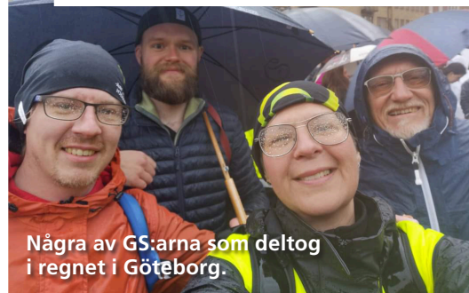
Några av GS:arna som deltog i regnet i Göteborg.