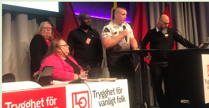
GS avdelning 4 informationsansvarige deltog i en paneldiskussion på mötet. Han blev också vald som ledamot i LO distriktets styrelse.