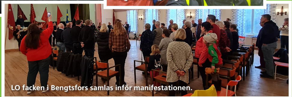
LO facken i Bengtsfors samlas inför manifestationen.