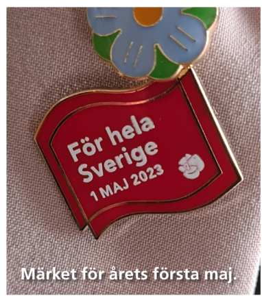
Märket för årets första maj.