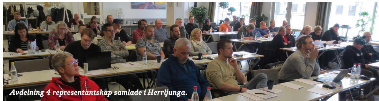
Avdelning 4 representantskap samlade i Herrljunga.

Där hittar du också kontaktuppgifterna till avdelningens personal.