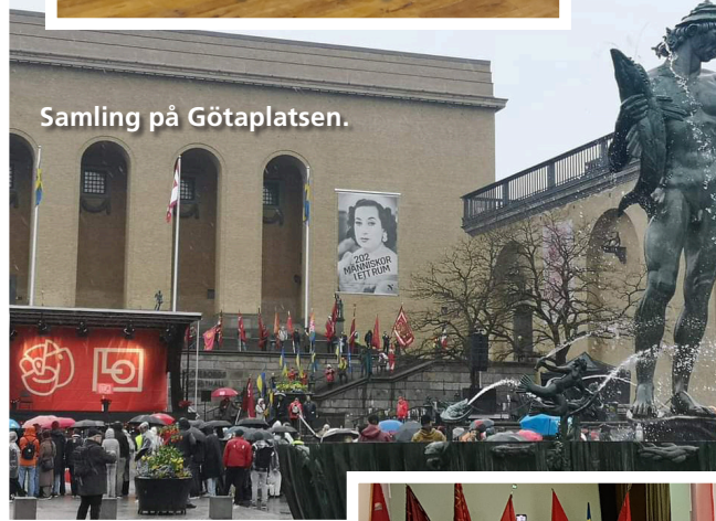
Samling på Götaplatsen.