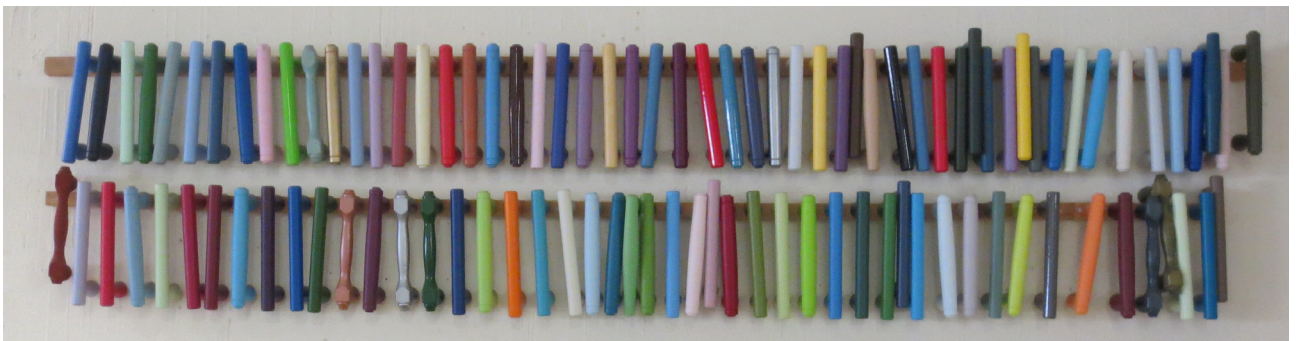
Ett litet urval på de handtag som kan finnas på en kista.