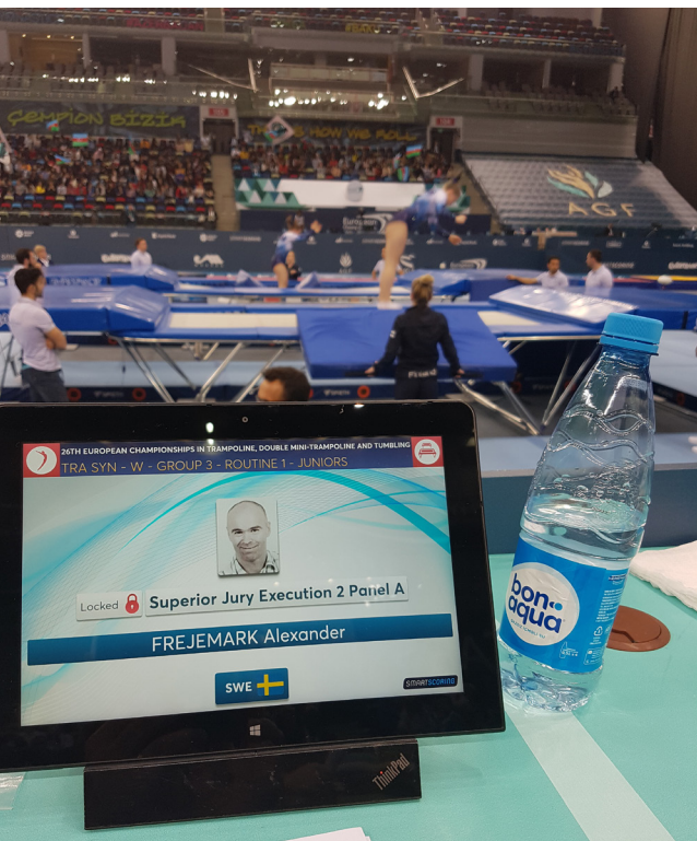
Alexander ute på domaruppdrag i trampolin.