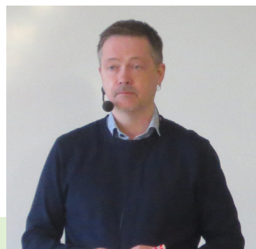
GS förbundsordförande gästade avdelningens representantskap.