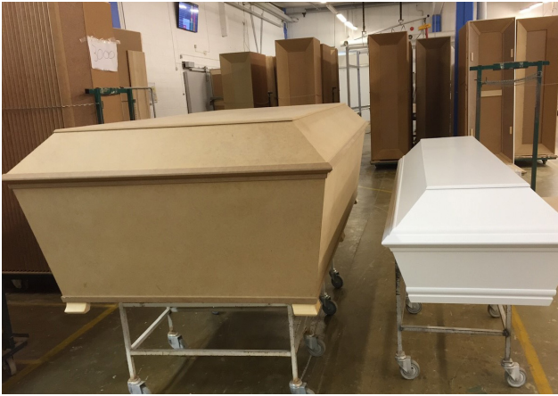
Ett mått på en föränderlig tid? Stora kistor blir alltmer efterfrågade.