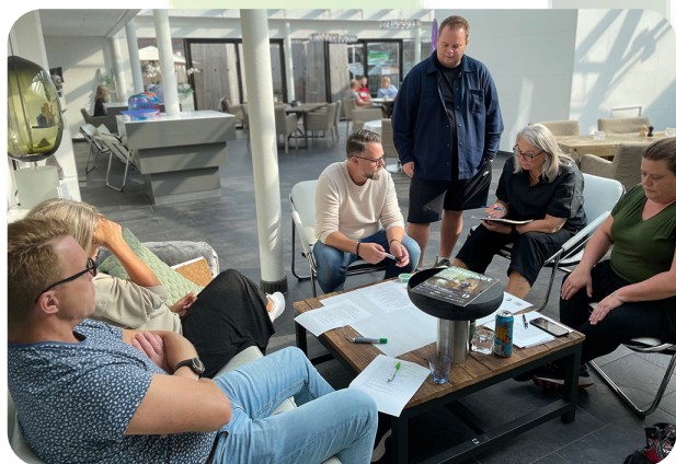
Grupparbete under verksamhetsplaneringen som gjordes i september av avdelningsstyrelsen och de anställda i GS avd. 3

Avdelningen har under september haft sin verksamhetsplanering och gjort en plan och budget för nästkommande år. Nästa steg är nu att avdelningens representantskapsmöte i oktober ska ta beslut om detta. Mötet består av ombud från många arbetsplatser i vår avdelning.