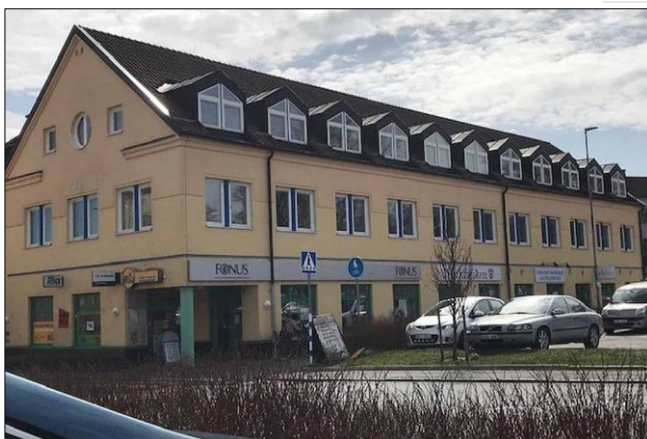
Ett nytt avdelningskontor kommer att befinna sig i Värnamo där GS kommer att husera på andra våningen

val av förtroendevalda i avdelningen och behandling av ärenden som sker på ett årsmöte. Den nya avdelningsstyrelsen ska verka från och med den 1/1 2021.