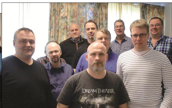
2014, övre bilden