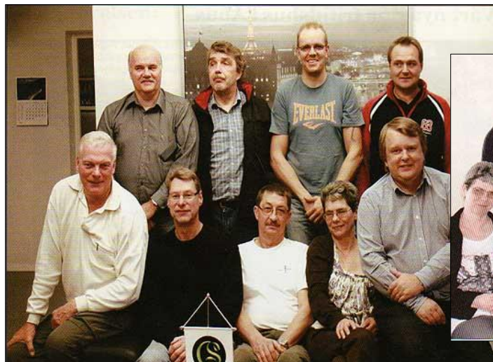
Interimsstyrelsen 2009 t.v samt 2011 (under)

Här nedan följer en del av de styrelser som utnämnts under åren som avdelning 3 verkat. De flesta bilderna är ofullständiga och alltid är det någon som uteblivit.