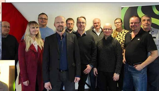
2018 års upplaga (övre bilden)

Styrelsen för nya avdelning 2 till vänster, vald den 8 oktober 2020, verkar från och med en 1 januari 2021