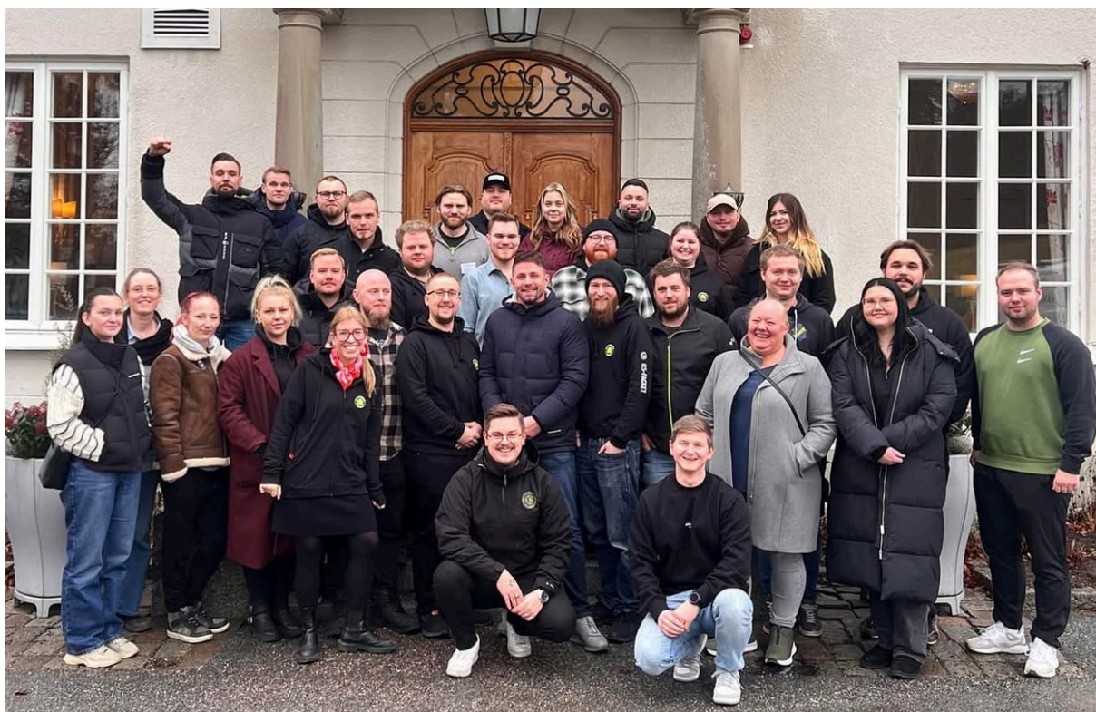
Senaste sammankomsten med GS Framtidsakademi