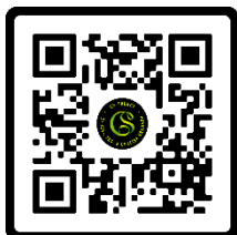
Mina sidor GS A-kassa

Många medlemmar missar att även gå med i GS a-kassa så kolla att du är med genom att logga in på Mina sidor på a-kassans hemsida gsakassa.se . Är du inte med i a-kassan rekommenderar vi dig starkt att gå med och det gör du på www.gsakassa.se/bli-medlem .