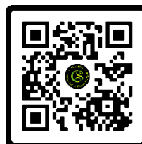
Bli medlem i GS A-kassa